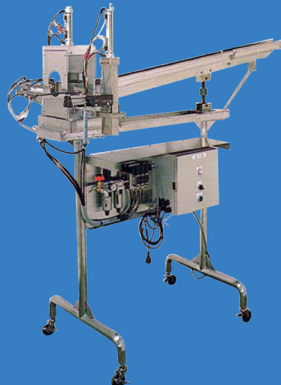
寒天自動定量裁断装置 [葛きり]用