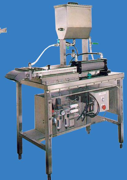
寒天自動定量裁断装置 [みつ豆]用