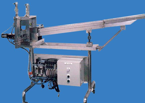
寒天自動定量裁断装置 [杏仁豆腐 / みつ豆]用