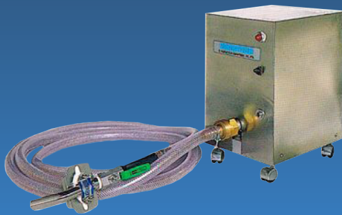
トコロテン自動充填装置